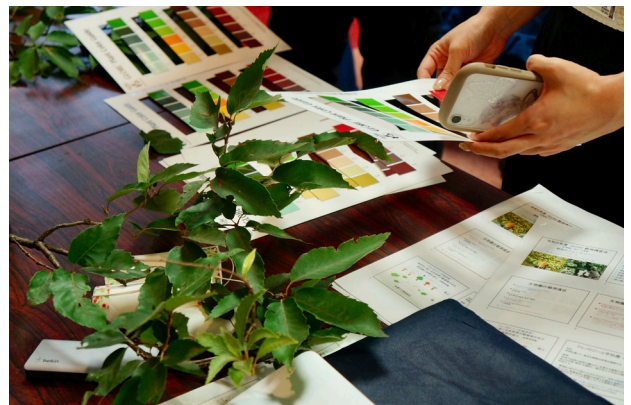
グローブティーチャー養成研修の様子