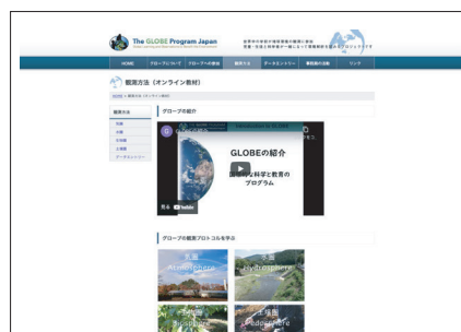
オンライン教材を公開しているウェブサイト