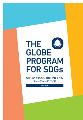
ティーチーズガイド（小学校編）